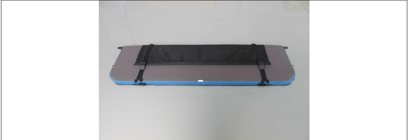
图 1 样品接收态外观代表性照片